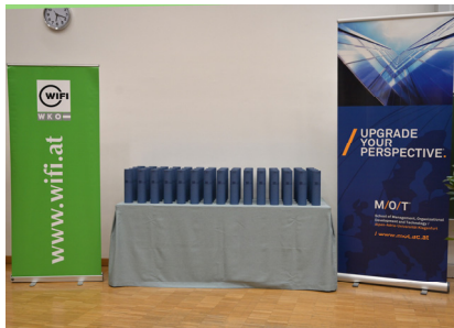
Akademische Feier in Klagenfurt 2024

“Erfolg besteht darin, dass man genau die Fähigkeiten hat, die im Moment gefragt sind.“ (Henry Ford)