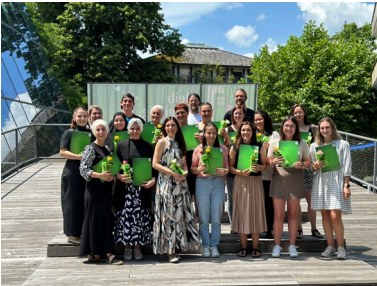
Absolvent:innen des Lehrgangs 2024

„Hilf mir, es selbst zu tun.“ (Maria Montessori)